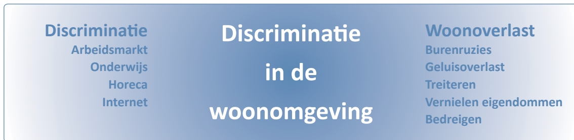
Figuur 1: de samenhang tussen discriminatie op verschillende maatschappelijke terreinen en vormen van woonoverlast

In de praktijk wordt vaak veel te laat onderkend dat er bij woonoverlast sprake is van discriminatie. Met het tijdig her- en erkennen ervan valt veel winst te behalen. Discriminatie kan namelijk allerlei andere problemen bij de gedupeerde veroorzaken, zoals werkloosheid, schulden, vereenzaming en andere psychische klachten. Het is daarom belangrijk om er vanaf het begin alert op te zijn of persoonskenmerken van een van de partijen een rol spelen in het conflict. Vaak gaat het om complexe situaties, die zorgvuldig en deskundig onderzoek vereisen om de overlast goed te kunnen duiden. Is er sprake van discriminatie en zo ja, hoe, door wie en in welke mate? Gebleken is dat zowel de melder van overlast als de beklaagde slachtoffer van discriminatie kan zijn. En ook degene die probeert de zaak op te lossen (bijvoorbeeld de medewerker van de corporatie, hulpverleningsinstelling, politie of het antidiscriminatiebureau) kan onderwerp van discriminatie en bedreiging worden als het de dader niet zint dat hij wordt aangesproken op zijn gedrag.